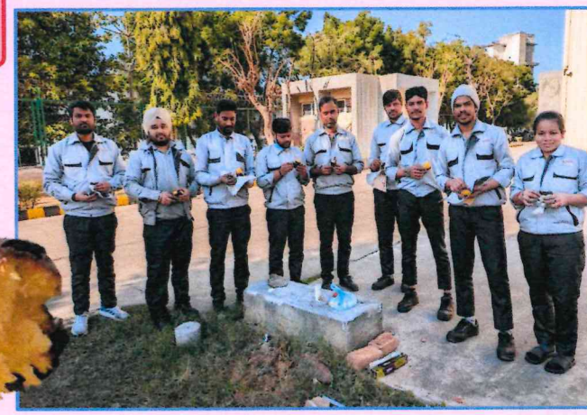
小長井執行役員より

2025/01/24本日、会社のバックヤードで焼き芋パーティーでした。 この1週間で寒さはやわらぎました。このまま暖かくなってくれる事を願うばかりです。