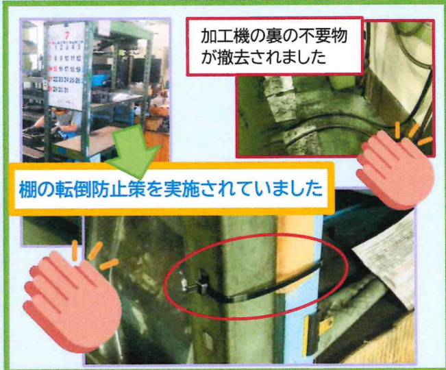
加工機の裏の不要物が 撤去されました

安全パトロールが7月から開始され3ヵ月立ちました。 自部署・他部署をまわって危険な箇所を上げています 対策されていたので紹介します。